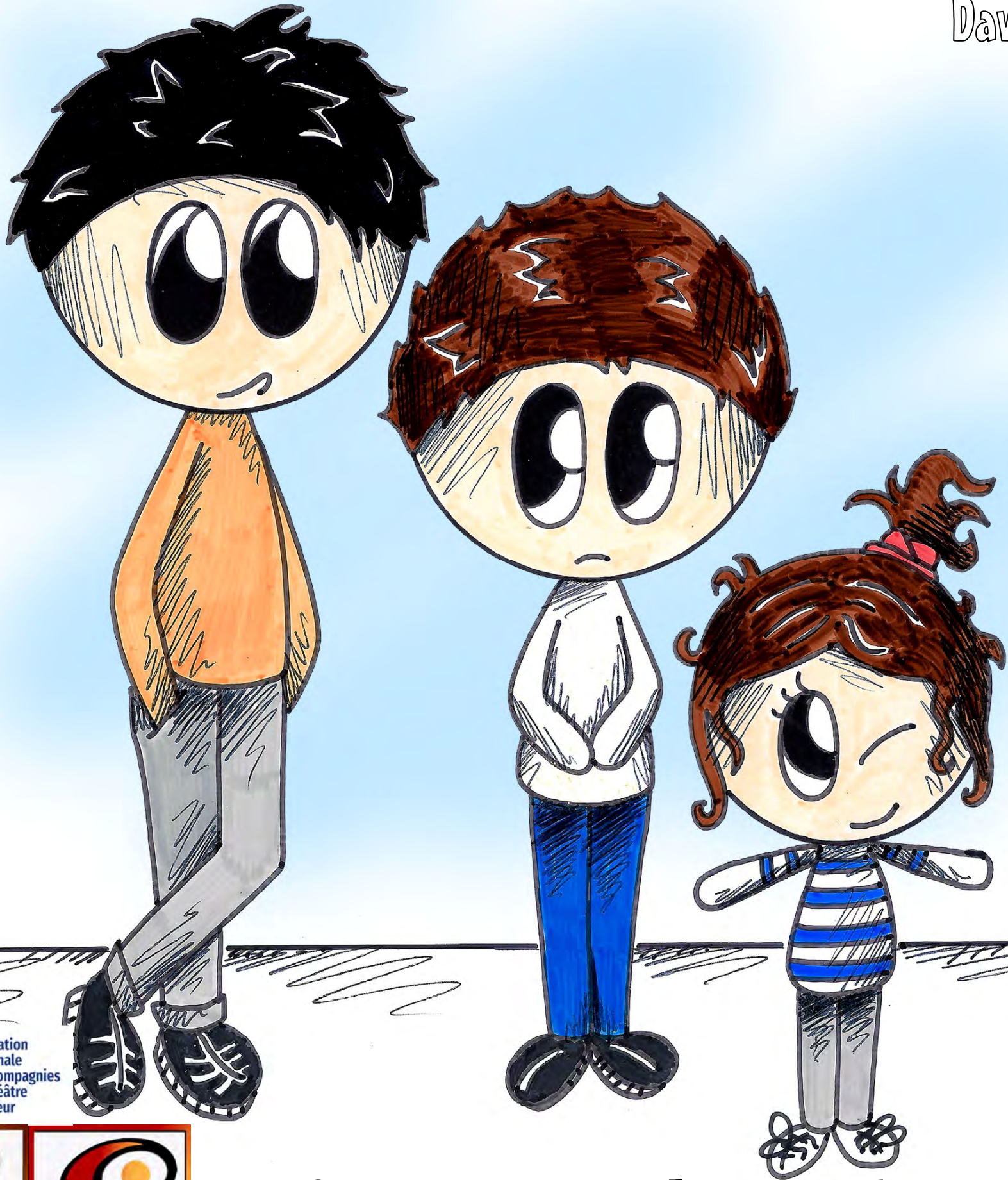
Illustration créée par Amandine CHAUD

Lecture de « J'AI TROP PEUR » David LESCOT